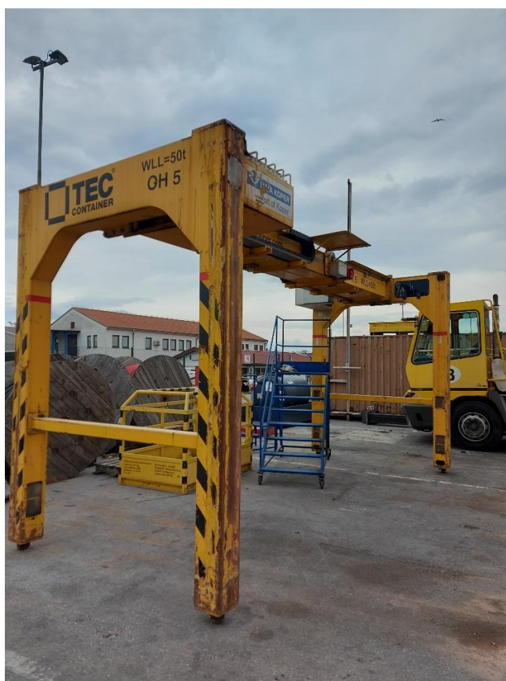
Slika 1: Prijemalo za izven gabaritne tovore (OH prijemalo)

Luka Koper d.d., PC Kontejnerski terminal, Garaža Kontejnerski terminal